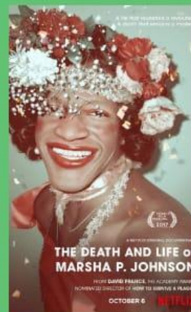
A MORTE E A VIDA DE MARSHA P. JOHNSON